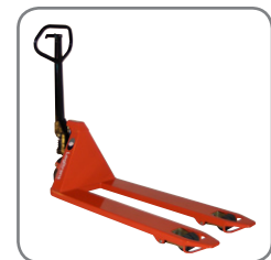
Panther Silent hat permanenten Schnellhub.

Gerne bieten wir Ihnen auch kundenspezifische Lösungen an.