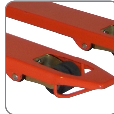
Gleitbügel an den Gabelspitzen ermöglichen ein einfaches und leichtes Hinein- und Herausfahren aus Paletten.