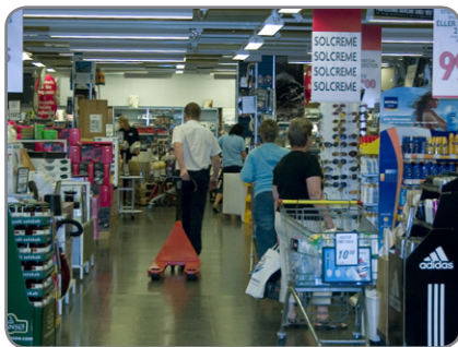
Panther Silent in einem Supermarkt, wo Komfort und Wohlbefinden der Kunden von großer Bedeutung sind.