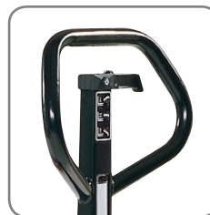
Die ergonomische Deichsel gewährt einen entspannten Griff.