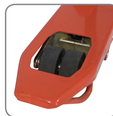
Die Zwillingsgabelrollen sichern optimale Drehbewegungen.