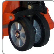
Spezielle Gummiräder schonen empfindliche Bodenbeläge und haben hervorragende anti-statische Eigenschaften.