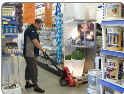
Auch in sehr schmalen Gängen können Güter problemlos transportiert werden.