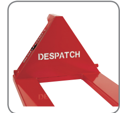
Firmennamen bzw. Logo des Kunden können im Dreieck des Wagens ausgeschnitten werden.